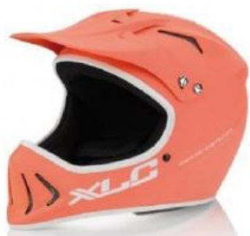
Casque intégral monocoque