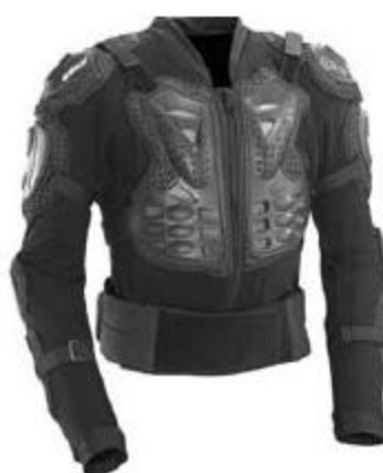
Gilet intégral de protection (D30 acceptée)