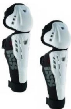
Protections genoux tibias