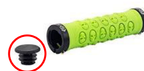
Embout de guidon obligatoire